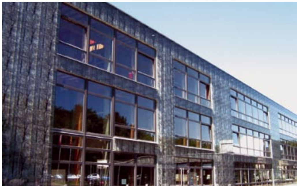
Ecole du Bois-Gourmand