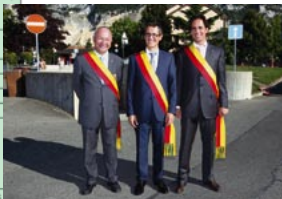
Le Conseil administratif de Veyrier