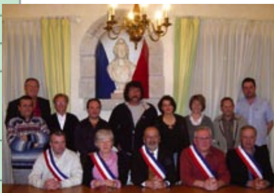
Le Maire et les conseillers municipaux d'Etrembières